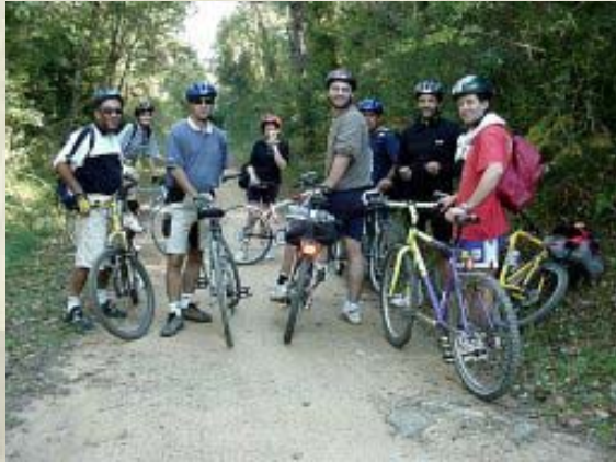
Penya ciclista "La Lifara". Via Verda Olot – Girona. Octubre 2002.