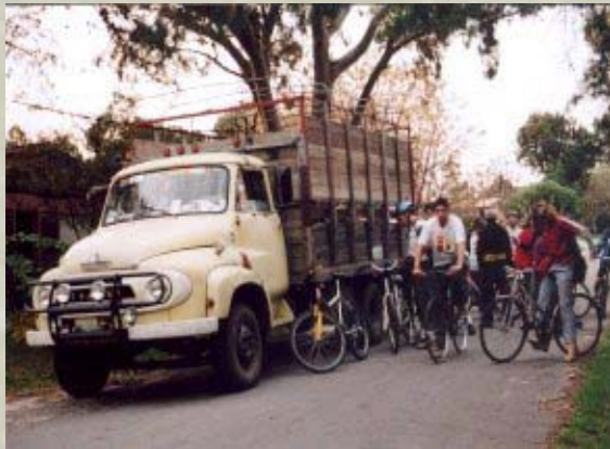
Intercanvi amb el Liceo de Colonia Suiza Nueva Helvecia (Uruguai). Agost 2004.