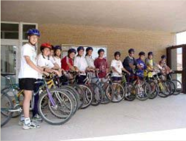
Crèdits Comuns: 6 sortides anuals / grup ESO.