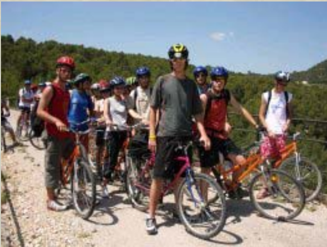
Crèdit de Síntesi: Segre amunt, Segre avall.