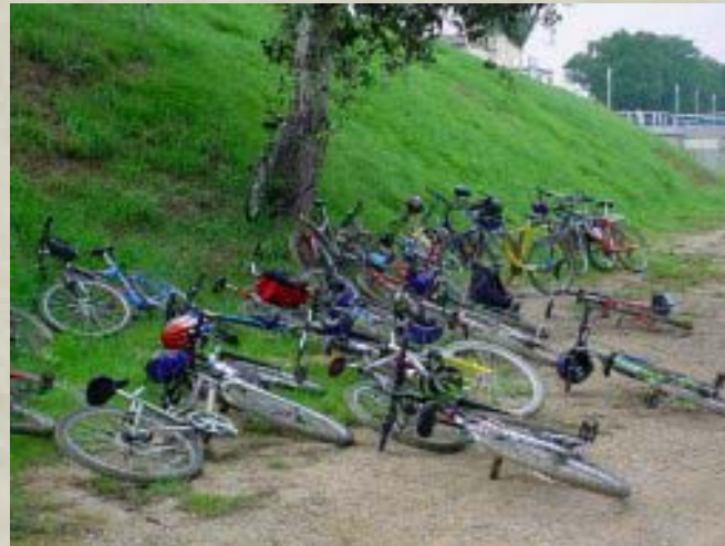
Ciències Naturals: Projecte RIU