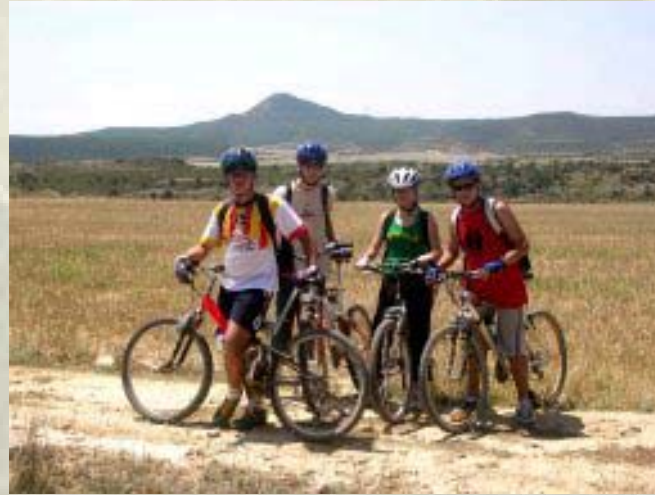
Crèdit Variable: Orientació a peu i en bicicleta.