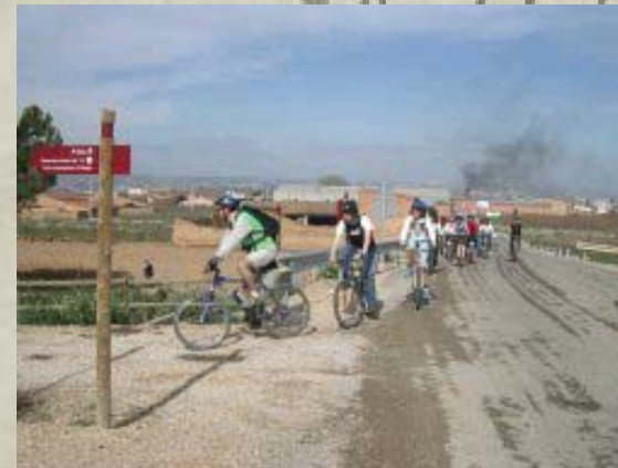
Intercanvi amb Archidosso (Itàlia) Cursos 2004-2006