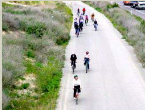
Intercanvi amb Sundsval (Suècia) Curs 2003-2004