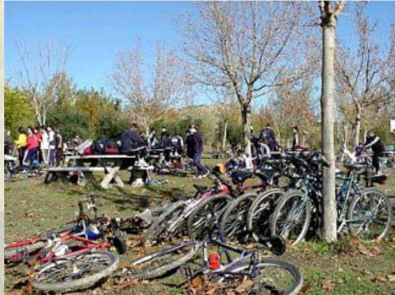
Diada de la Castanyada