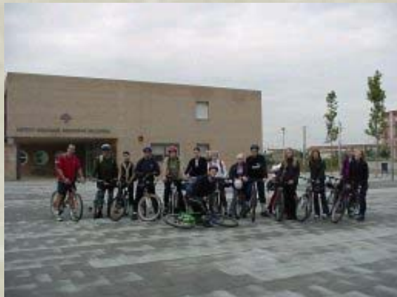
Intercanvi amb Lumijoki (Finlàndia) Curs 2002-2003

Gimcana a la diada de Sant Jordi Pla d'Acció Tutorial: visites a empreses. Treball en petit grup amb alumnat conflictiu del centre.