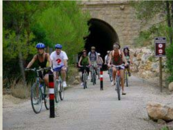
Penya ciclista "La Lifara". Via Verda del Baix Ebre. Juliol 2004.