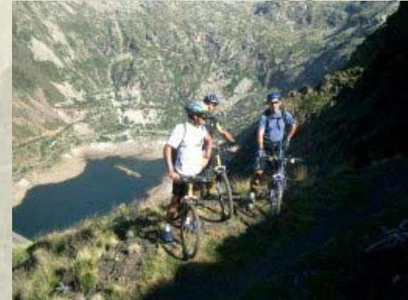
Penya ciclista "La Lifara". Estany Gento. Juliol 2005.