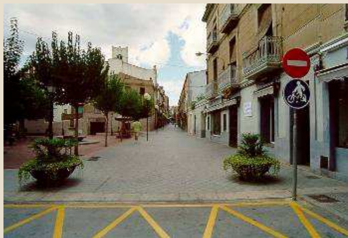
Carrers per vianants, zones 30,..

Nous plans de mobilitat sostenible, més carrers pels ciutadans