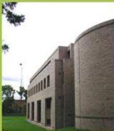
Edificio de Postgrados Ciencias Humanas