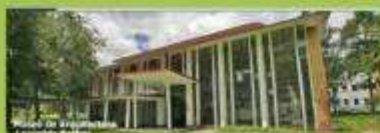
Museo de Arquitectura Leopoldo Rother